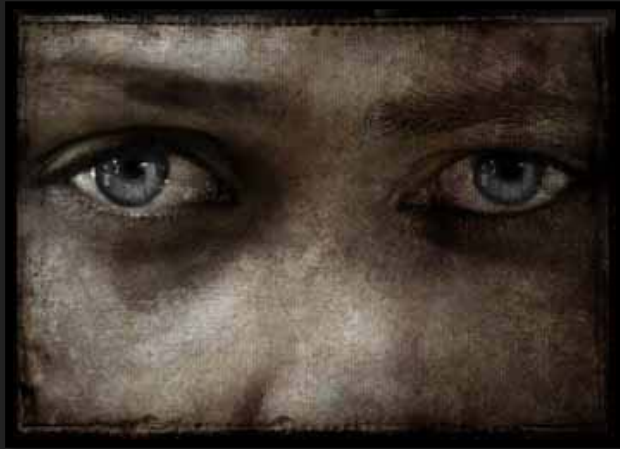
Ailin [Stampa cromogenica, 70x50cm]