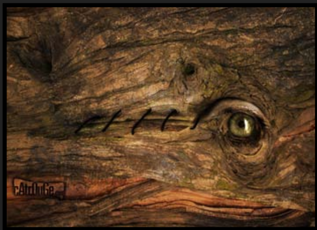
Millenaria Ostinazione [Stampa cromogenica, 70x50cm]