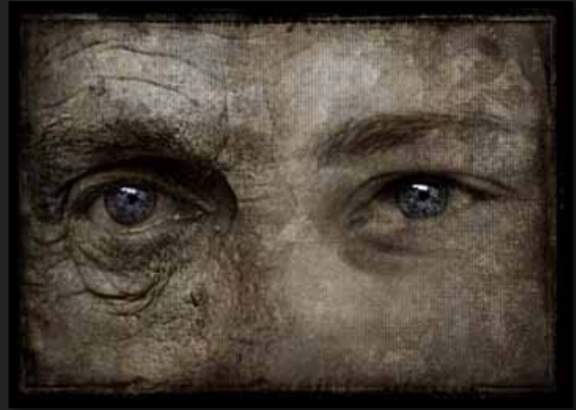
Idwal [Stampa cromogenica, 70x50cm]