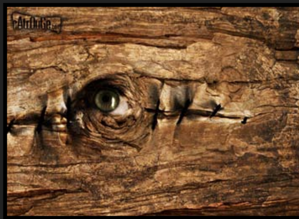
Ukaidi [Stampa cromogenica, 70x50cm]